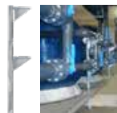
Cod. 1080104 Supporto regolabile Adjustable support