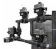
Batteria controlavaggio elettro attuata Electric actuated Backwash battery