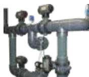
Batteria ad azionamento pneumatico Batteries with pneumatically operation