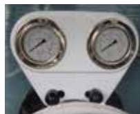
Cod. 1080110 Piastra a due manometri Plate with two pressure gauges